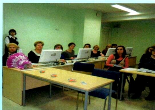
БОП «Агалатовская СОШ». 19.11.2014 г.