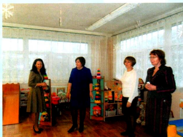
Семинар для руководителей базовых (опорных) площадок дошкольных образовательных организаций в МДОУ комбинированного вида «Детский сад № 6» г. Волосово. 11.12. 2014 г.