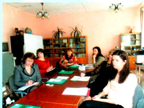
Семинар для руководителей базовых (опорных) площадок дошкольных образовательных организаций в МБОУ комбинированного вида «Детский сад № 36» г. Кировска. 22.04.2015 г.