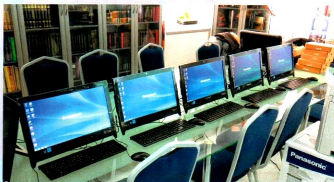
БОП «Кировская гимназия». Декабрь 2014 г.

Объединенные сетевым взаимодействием базовые площадки стали центром развития региональной корпоративной системы повышения квалификации.