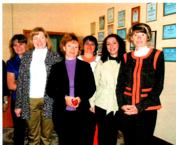
Группа руководителей дошкольных образовательных организаций г. Казани. Стажировка в МБДОУ № 14 «Детский сад комбинированного вида» п. Тельмана» Тосненского района. 18.06.2014 г.

В основе модели создание условий для взаимодействия коллегиальных органов управления ДОО, общественных и профессиональных объединений через реализацию целевых проектов и программ, направленных на развитие организации. Повышение информационной открытости ДОО посредством публикации сведений о деятельности организации на официальном сайте детского сада в сети Интернет, публичная отчетность, социальное партнерство учреждения и представителей общественности, решение вопросов преемственности в организации и содержании работы органов государственно-общественного управления на уровне дошкольного и начального общего образования. Повышение уровня профессиональной компетентности руководителя, его управленческих умений в условиях сотрудничества и взаимодействия.